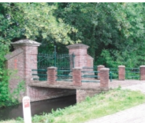
Toegangspoort met brug en hekwerk van de Rooms-katholieke Begraafplaats in Purmerend